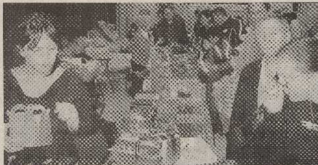
Plus de 1 500 personnes se sont côtoyées au salon du chocolat organisé par le Rotary Côte Bleue et ont dégusté et découvert tout l'univers de ce délicieux produit.

À sa quatrième édition, le salon du chocolat a fermé ses portes au grand public, salle de l'espace Fernandel. Le Rotary Côte Bleue a de nouveau organisé un grand succès en proposant cette manifestation annuelle, culturelle et humanitaire. Plus de 500 personnes ont été présentes au salon.