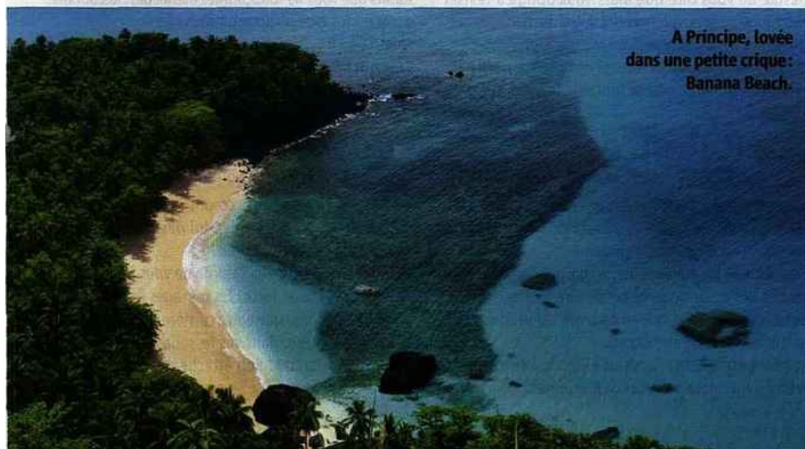
A Príncipe, lovée dans une petite crique : Banana Beach.